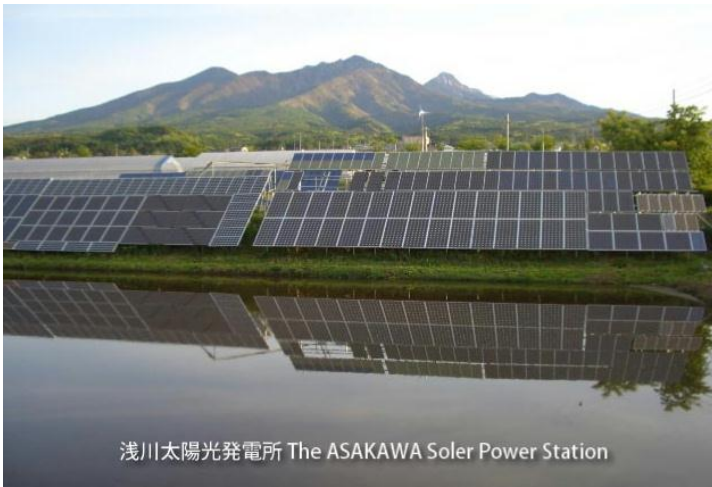
浅川太陽光発電所 The ASAKAWA Solar Power Station